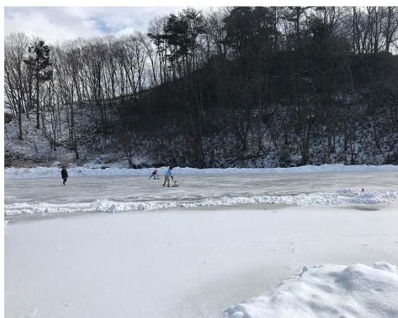
2020年2月 左から、松田、高橋、大内秀一さん 2019年2月 山木屋田んぼスケートリンク