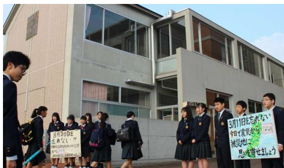
2011年11月11日から続く「思いを寄せる日」

台風、豪雨、地震など、全国各地で災害が多発し、甚大な被害が相次ぐ。私たちも西日本豪雨災害を経験した。震災はいつでも誰にでもふりかかる。だから日頃から身近な人々とのつながりを大切にすること。かけがえのない命を守るために備え、同じように仲間の命を大切にすること。それがあの日を忘れないこと。