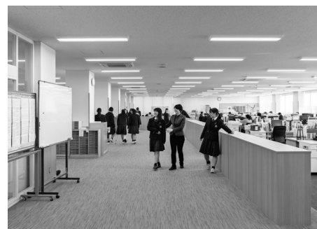
職員室 [自由に出入り出来ます。扉はありません]

「建学の精神『実学の体得』社会に貢献する人を育てる」 / 「平和・ひと・環境を大切にする学び舎」