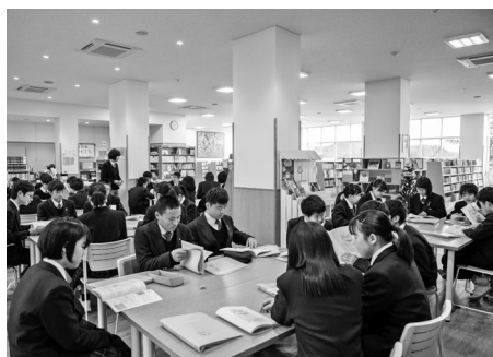
図書館 [新刊6,000冊・通常の3倍]